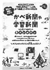
応募の手引き (応募用補助教材)